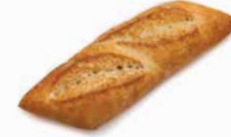
4400055 Rustik Köy Ekmeği